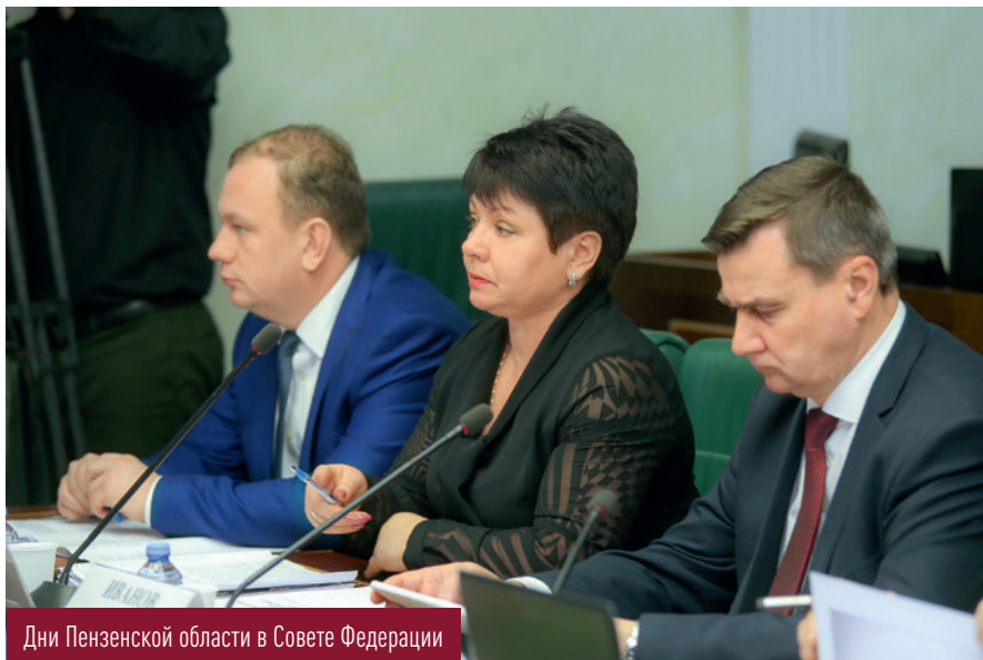
Дни Пензенской области в Совете Федерации

кизово». На субсидирование затрат в данной сфере в целом направляется порядка пяти процентов от общего объема расходов бюджета.