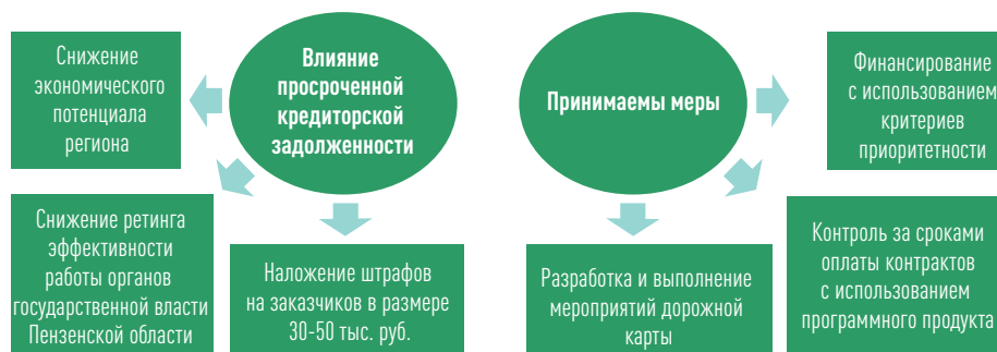
Рисунок 2. Мониторинг состояния расчетов по принятым обязательствам

Результат — отсутствие просроченной кредиторской задолженности в течение 2018 года